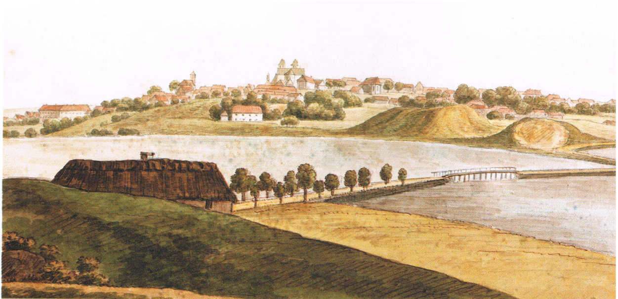
Viborg set fra Asmild 28. juni 1821 af O.J. Rawert. De to banker til højre i billedet er Borgvold og den nu forsvundne Lille Borgvold.

Betaling opkræves i forbindelse med forfriskningen i Kongens Kammer. Der kan betales kontant eller via mobilepay.