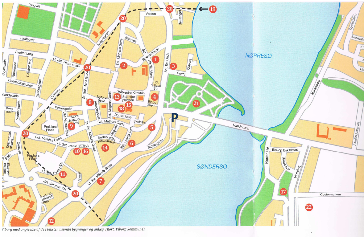
Viborg med angivelse af de i teksten nævnte bygninger og anlæg. (Kort: Viborg kommune).